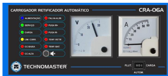
Figura 1 – Vista Frontal.